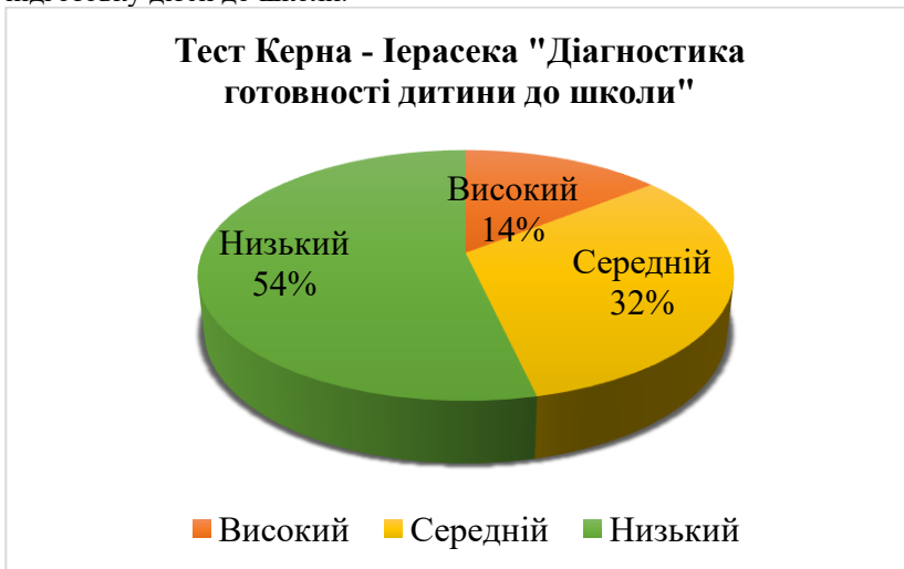
Рис. 2. Результати тесту Керна-Іерасека «Діагностика готовності дитини до школи»

При визначенні загального рівня психічного розвитку, рівня розвитку мислення, вміння слухати, виконувати завдання за зразком, довільності психічної діяльності для діагностики знань дітей, що готуються йти в перший клас використовують тест Керна-Іерасека. Результати видно на рис. 2, показники з високим рівнем досягають всього – 14% дітей, середній рівень – 32% дітей та 54 % дітей з низьким рівнем готовності до школи. Результати свідчать в більшості про низьку підготовку дітей до школи.