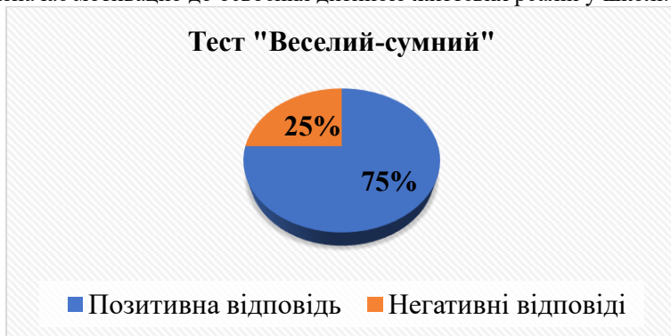
Рис. 4. Результати тесту «Веселий-сумний»

освітньої практики. Несприятливі особистісні особливості дітей відображаються в навчальній діяльності, низькі досягнення в діяльності і негативне ставлення до школи показали 25,2% дітей. У зв'язку з вищесказаним ми визначили внутрішнє ставлення дитини до школи, виходячи з центрального компонента психологічної готовності, що визначає мотивацію до освоєння дитиною життєвих реалій у школі.