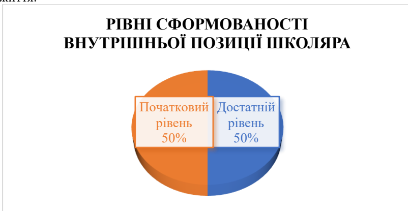
Рис. 5. Результат за методикою «Бесіда про школу»

Використовуючи методику «Бесіда про школу» у досліджуваній групі було виявлено 50% дітей з достатнім рівнем готовності, що свідчить про шкільну-навчальну орієнтацію дитини та позитивне ставлення до школи. Для інших 50% дітей характерний початковий рівень сформованості внутрішньої позиції дошкільника, тобто переважний інтерес дитини до зовнішньої атрибутики шкільного життя.