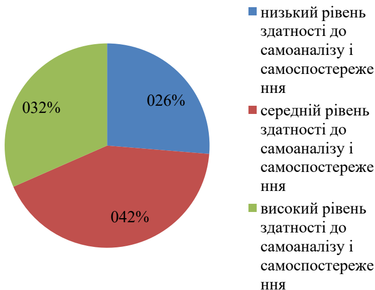
Рис. 1. Рівень здатності до самоаналізу і самоспостереження у дослідженій вибірці згідно самозвітів

Для унаочнення отримані дані представлено на рисунку 1.