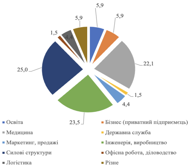
Рис. 1. Розподіл респондентів за сферами професійної діяльності у цивільному житті, %