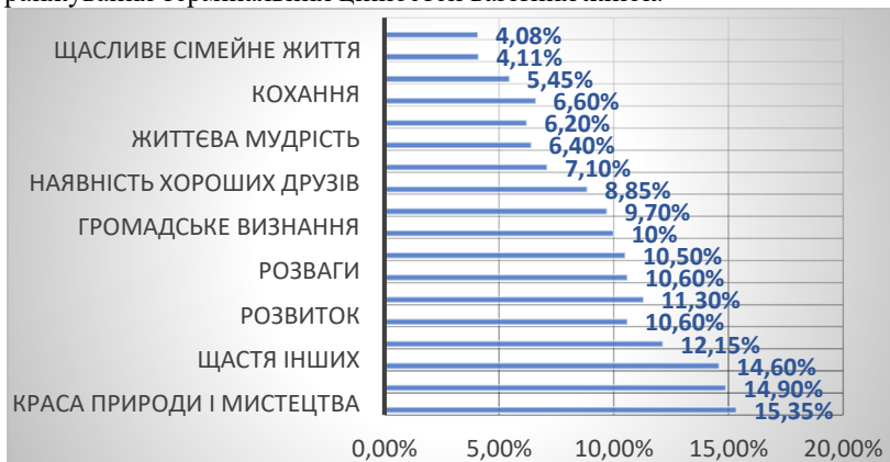
Рис. 1. Ранжування термінальних цінностей

Також у дослідженні було використано методику «Ціннісні орієнтації» М. Рокича [20]. Ця методика дає можливість виявити значущість таких життєвих пріоритетів, як сім'я, любов, щастя, діти, відповідальність, гармонійні взаємини та турбота про близьких, що є важливими показниками сформованості мотиваційно-ціннісної складової готовності до материнства. На рисунку 1 представлено ранжування термінальних цінностей вагітних жінок.