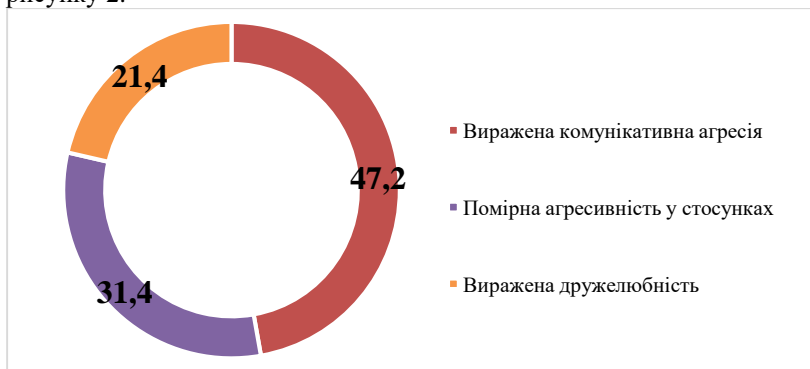
Рис. 2. Показники агресивності у стосунках за тестом А. Ассінгера, %

За результатами тесту «Оцінка агресивності в стосунках» А. Ассінгера було виявлено, що 47,2% осіб підліткового віку мають виражену комунікативну агресію, 31,4% респондентів показали помірну агресивність у стосунках, решта 21,4% підлітків демонструють виражену дружелюбність. Отримані результати відображено на рисунку 2.