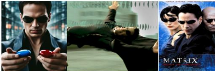
Рис. 2 Фрагмент презентації філософсько-психологічного аналізу фільму «Матриця»

Символіка та метафори. Червона та синя пігулки: вибір між незнанням і болісною правдою. Матриця: метафора суспільства, суспільних систем, що контролюють і маніпулюють. Типологія персонажів за К.Юнгом: Морфеус – ментор, Нео – герой, Триніті – супутник, агент Сміт – Тінь.