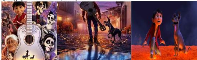
Рис. 3. Фрагмент презентації філософсько-психологічного аналізу мультфільму «Коко»

Пошук себе у житті, суспільстві, світі, формування особистості, відповідальність про свої вчинки, подолання своїх страхів та досягнення мети завдяки сміливості й наполегливості, важливість соціальних зв'язків і зберігання свого коріння, гордість за культурну ідентичність – це все про Коко!