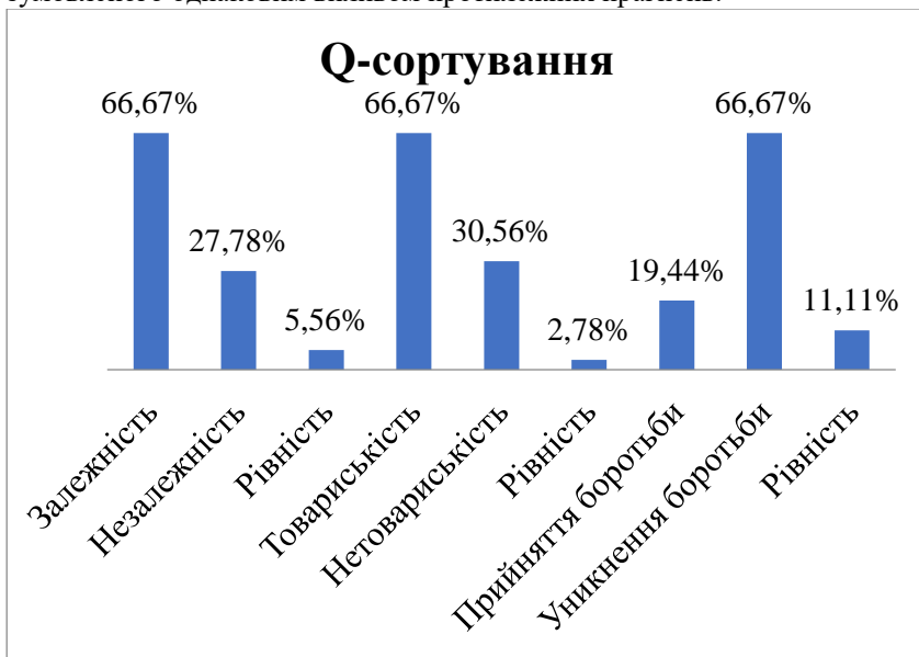
Рис. 1. Результати дослідження міжособистісних тосунків за методикою «Q-сортування» В. Стефансона

приймати групові стандарти й цінності. До категорії «рівність» ми віднесли підлітків, в яких кількість відповідей «так» для обох тенденцій однакова, це може вказувати на наявність внутрішнього конфлікту, зумовленого однакоvim впливом протилежних прагнень.