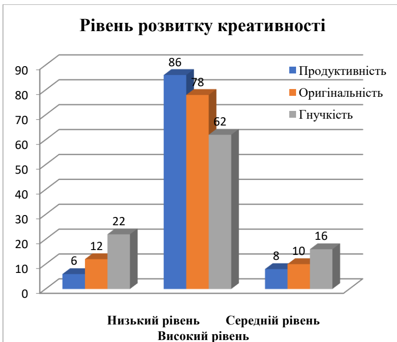
Рис. 2. Розподіл показників креативності здобувачів психологічної освіти за методикою П. Торренса, (у %)

Високий рівень креативності майбутніх психологів не лише дозволяє бачити багатовекторність шляхів розв'язання проблеми та супроводжувати процес життєтворчості клієнта, а також впливає на здатність працювати у мінливих кризових умовах воєнного часу, сприяє саморозкриттю, саморозвитку та самоактуалізації.