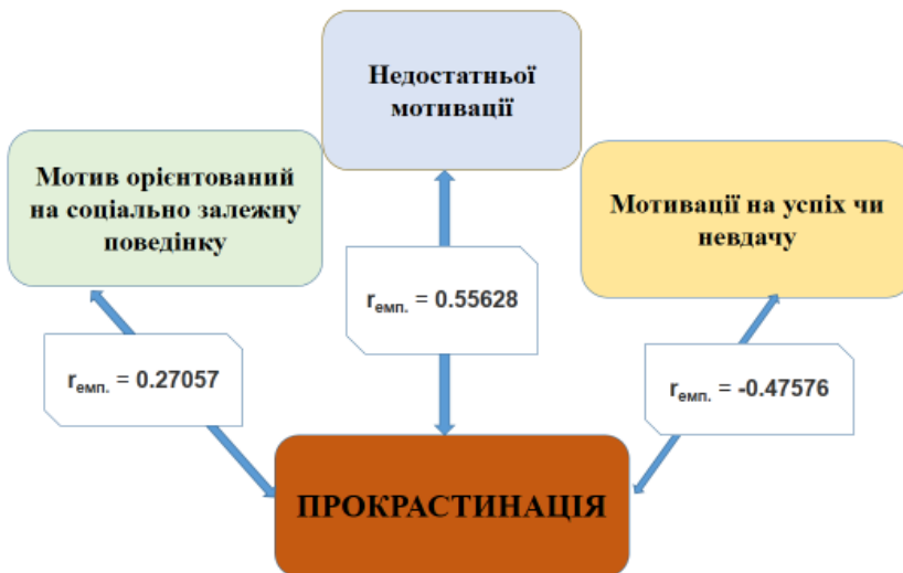
Рис. 4. Кореляційні зв'язки за результатами діагностики