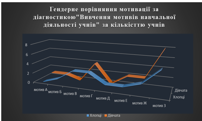
Рис. 2. Гендерне порівняння мотивації за діагностикою «Вивчення мотивів навчальної діяльності учнів»

В дослідженні після констатації факту присутності прокрастинації в учнів старших класів паралельно вивчався і стан мотивації учнів. На даному етапі дослідження було виявлено, що учні мають високі показники по показнику «недостатня мотивація» та високі показники по зовнішній мотивації.